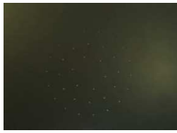
マクロ（広角）撮像で孔位置座標取得