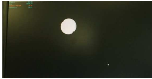
表面つまり検査 NG時