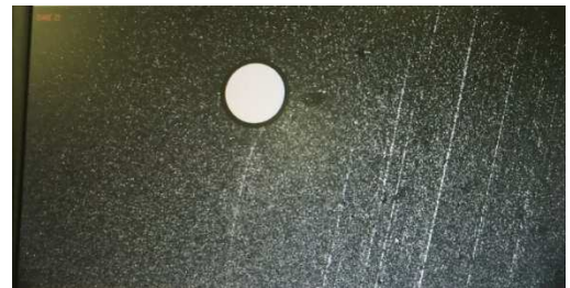
表面摩耗（ダレ）検査 NG時